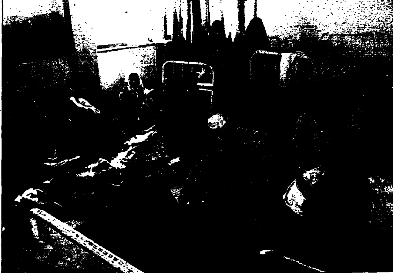
امهات عراقيات مع أطفالهن في مستشفى صمد بغداد (رويتز)

التي تحلقت في بغداد في وقت مبكر من صباح يوم الاثنين 13 حزيران (يونيو) 1998.